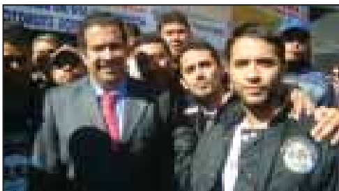
Robson com o ministro do Trabalho e Emprego, Carlos Lupi

O Sindicato dos Motoboys de Guarulhos e Região está na luta para garantir que todos os nossos companheiros possam também fazer parte desta conquista!