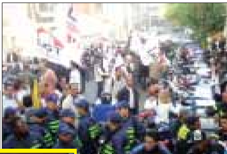
Categoria no evento de liberação da verba de financiamento de motofrete